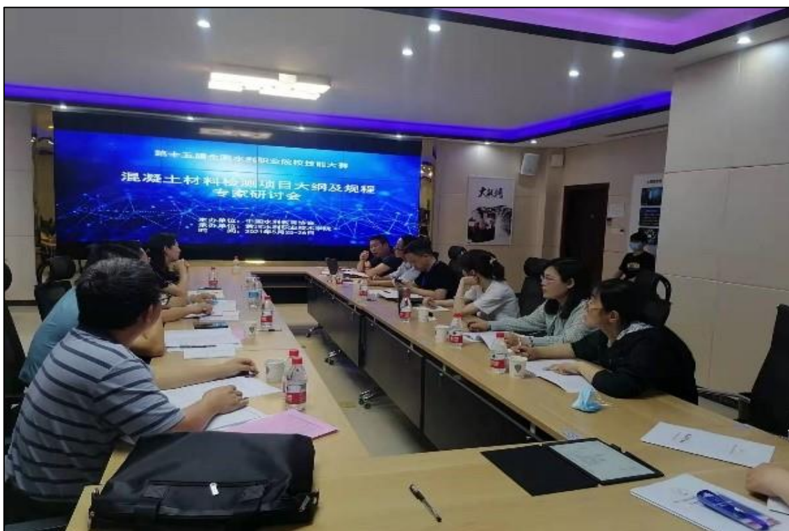
图 1-5 筹备水利职业院校技能竞赛“混凝土材料检测”赛项专家研讨会议