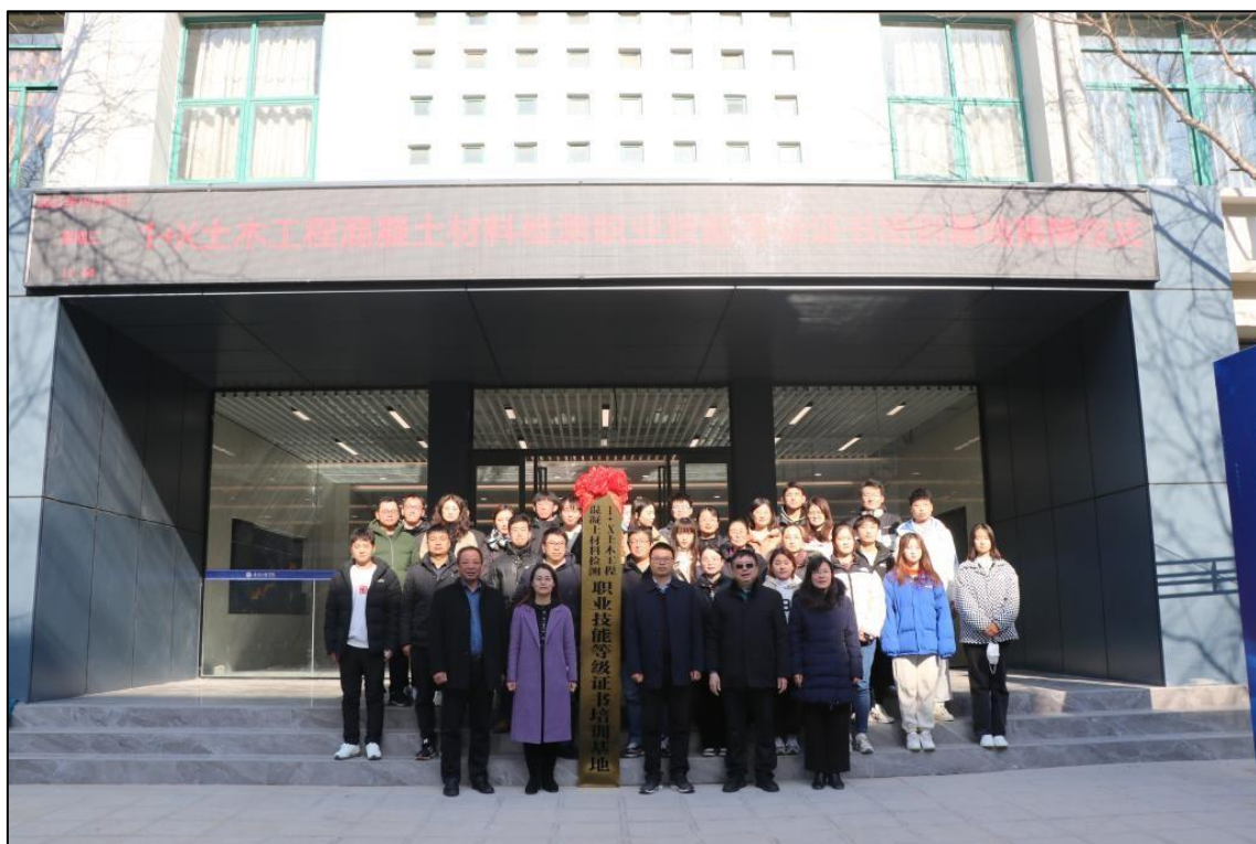
图 1-8 全国首家水利行业 1+X 证书培训基地揭牌仪式

业群相关师生见证了全国首家水利行业 1+X 证书培训基地揭牌仪式，也标志着专业群在“1+X”书证融通人才培养模式实践中实现了新的突破，也在新时代水利技术技能人才培养新模式探索中走出坚实步伐。全方位助力职业教育改革方案设计与实施，为企业、为社会培养更多的高素质劳动者和技术技能人才。