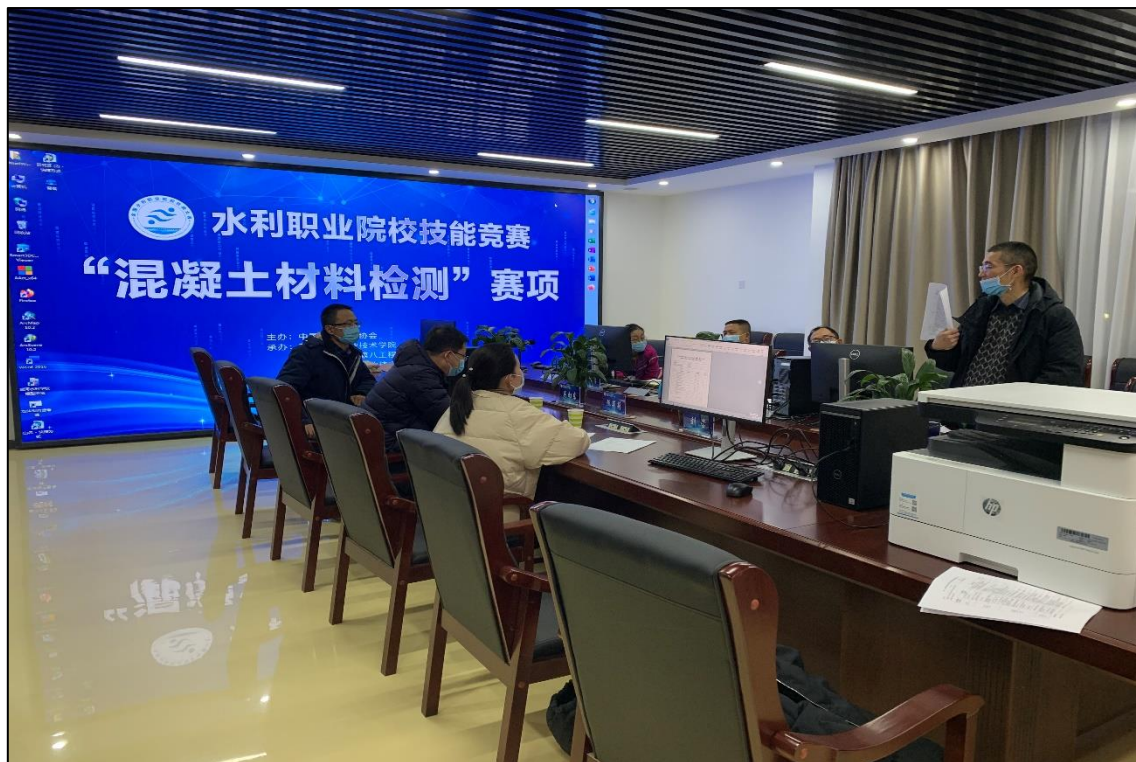
图 1-6 水利职业院校技能竞赛“混凝土材料检测”赛项赛前裁判会议

通过比赛，学生的职业能力、职业精神将得到淋漓尽致的展现，也给整合课程设置、提升专业教师实践技能、优化课程结构、改革规范教学评价等教学改革带来源源不断的动力。