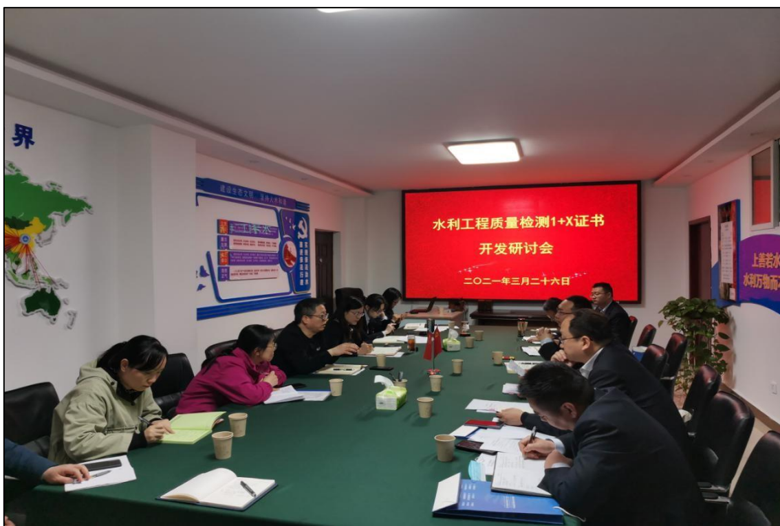
图 1-1 校企合作开展水利工程质量检测 1+X 证书开发研讨会议

技能等级证书制度，落实水利水电建筑高水平专业群 1+X 书证融通人才培养模式，推进 1+X 证书制度试点工作，促进专业群高水平建设，助力企业高质量发展。江河检测与黄河水利职业技术学院（简称黄河水院）合作为水利学子量身定制水利工程质量检测 1+X 职业技能等级证书（含岩土工程类、混凝土工程类、量测类三个专业），双方本着资源共享、优势互补、互惠互利、共同发展的原则，就师资团队建设、教学资源建设、实操培训基地建设、考核系统建设等达成合作共建意向，为深化复合型技术技能人才培养培训模式改革奠定了良好的基础。