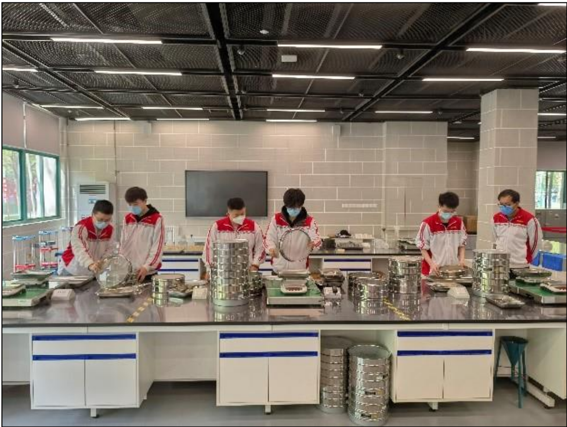
图 1-7 黄河工程安澜医院 1+X 证书实操技能培训中心

以社会需求、企业岗位需求和水利工程质量检测 1+X 证书职业技能等级标准为依据，设计体现新技术、新工艺、新规范、新要求的标准化的、智能化的工作场所和实践基地，按企业真实工作环境设置标准工作工位和标准实操考核工位，合作建成黄河工程安澜医院 1+X 证书实操技能培训中心，建设场地建筑面积 650m 2 ，建成胶凝材料检测、骨料检测、混凝土检测、力学性能检测 4 个检测区，实操工位 340 个、标准实操考核工位 80 个，可开展检测和生产项目 60 项，并实现“教、学、练、做、评、创、赛”一体化培训和管理。