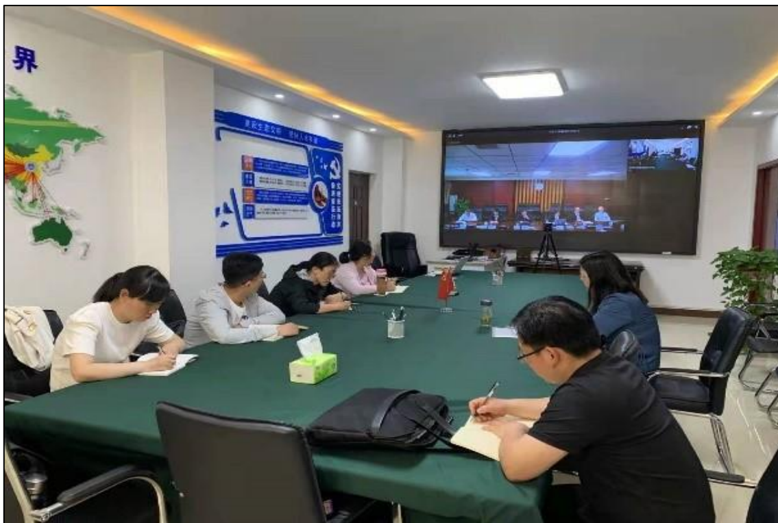
图 1-4 产教融合开展“岗课赛证”融通的人才培养模式改革视频会议

就是企业的招聘现场，通过竞赛为企业输送优秀人才。实现赛证融合，推进 1+X 证书制度试点工作，深化复合型技术技能人才培养培训模式改革，探索“岗课赛证”融通的人才培养模式改革。