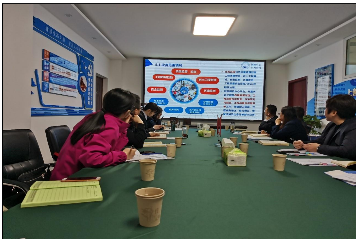
图 1-3 校企合作开展黄河工程安澜医院建设研讨会议

校企合作、产教融合，以社会需求、企业岗位需求和水利工程质量检测 1+X 证书职业技能等级标准为依据，江河检测与黄河水院共同对黄河工程安澜医院进行场地规划、设备采购、实践项目设计、检测能力提升、智能化改造等，将黄河工程安澜医院建成集“实践教学、师资培训、社会培训、技能鉴定、企业真实生产、技术服务、科技攻关、创新创业”八位一体的应用技术服务中心，打造中原经济区一流的智能检测技术服务平台。